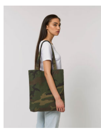
Tote Bag AOP