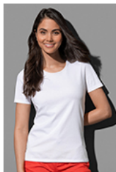
ST7600 Lux Fitted